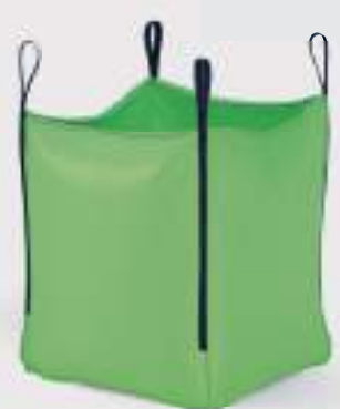
BigPack Eco Green