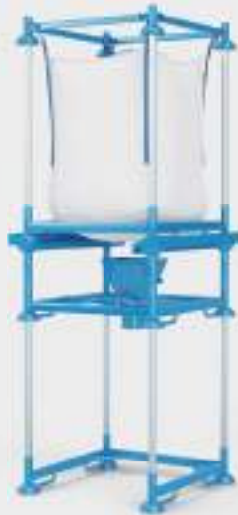
StackPack Conjunto dosificador