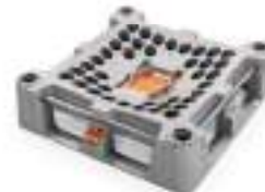
Food Grade Deck