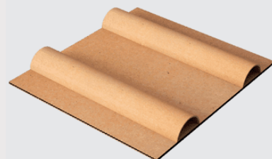
BigPack Ecoalet Cardboard