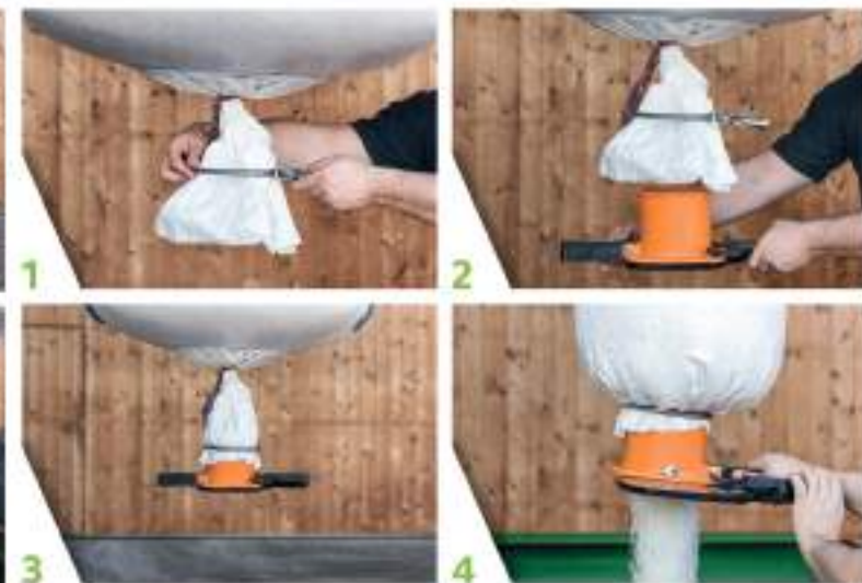
Montaje StackPack Dosificador Easy