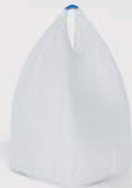
Bigpack 1 y 2 loops