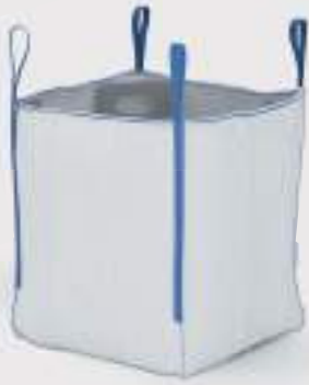
BigPack Q Bag