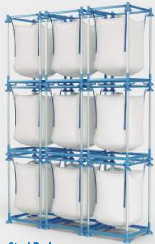
StackPack Conjunto almacenaje