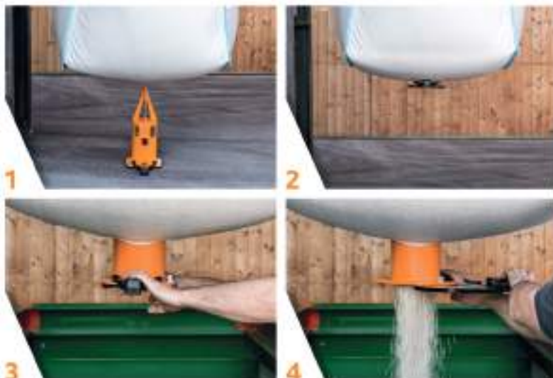
Montaje StackPack Dosificador Original