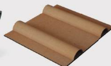
Novedad BigPack Ecopalet Cardboard