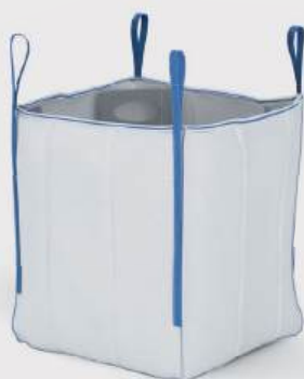
BigPack Q Bag