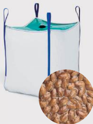
Novedad BigPack Atmosphere