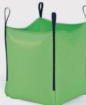
BigPack Eco Green