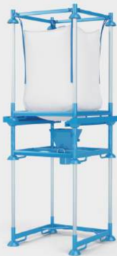
StackPack Conjunto dosificador