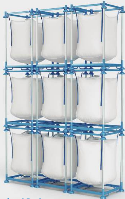
StackPack Conjunto almacenaje