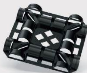
Novedad BigPack Palet