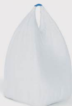
BigPack 1 y 2 Loops