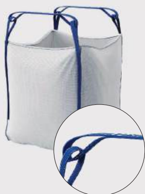
Novedad BigPack Stevedore